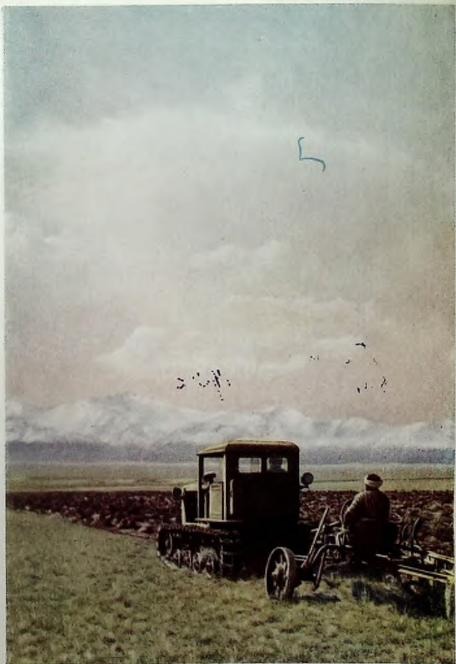
Подъем целины в Алайской долине. Фото В. Фоминского, 1952 г.